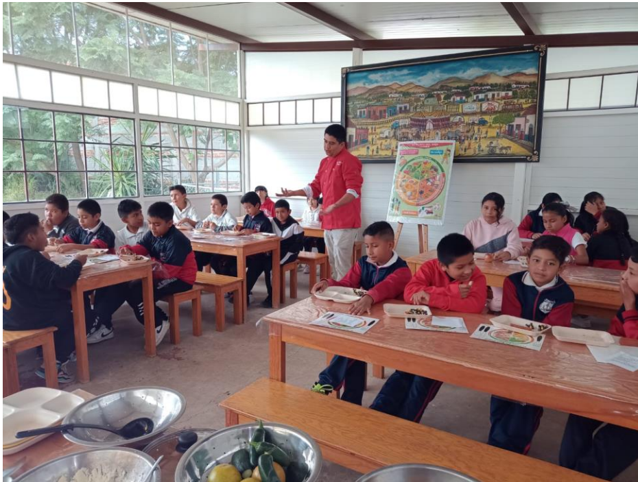
Nuevo pantoja primaria