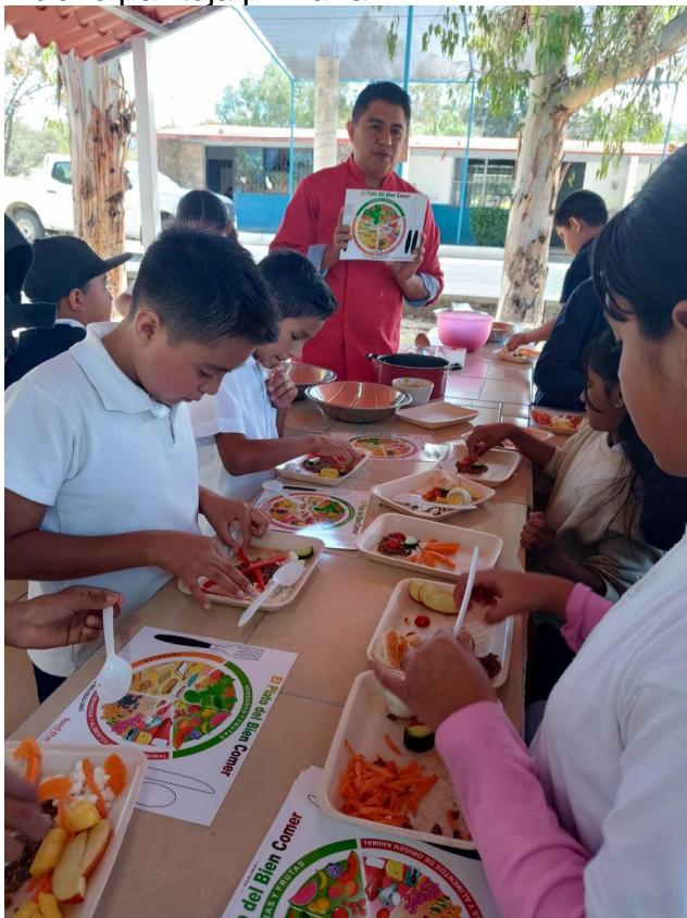
Fajardo de bocas.