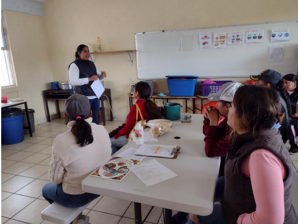
C añada de garcia